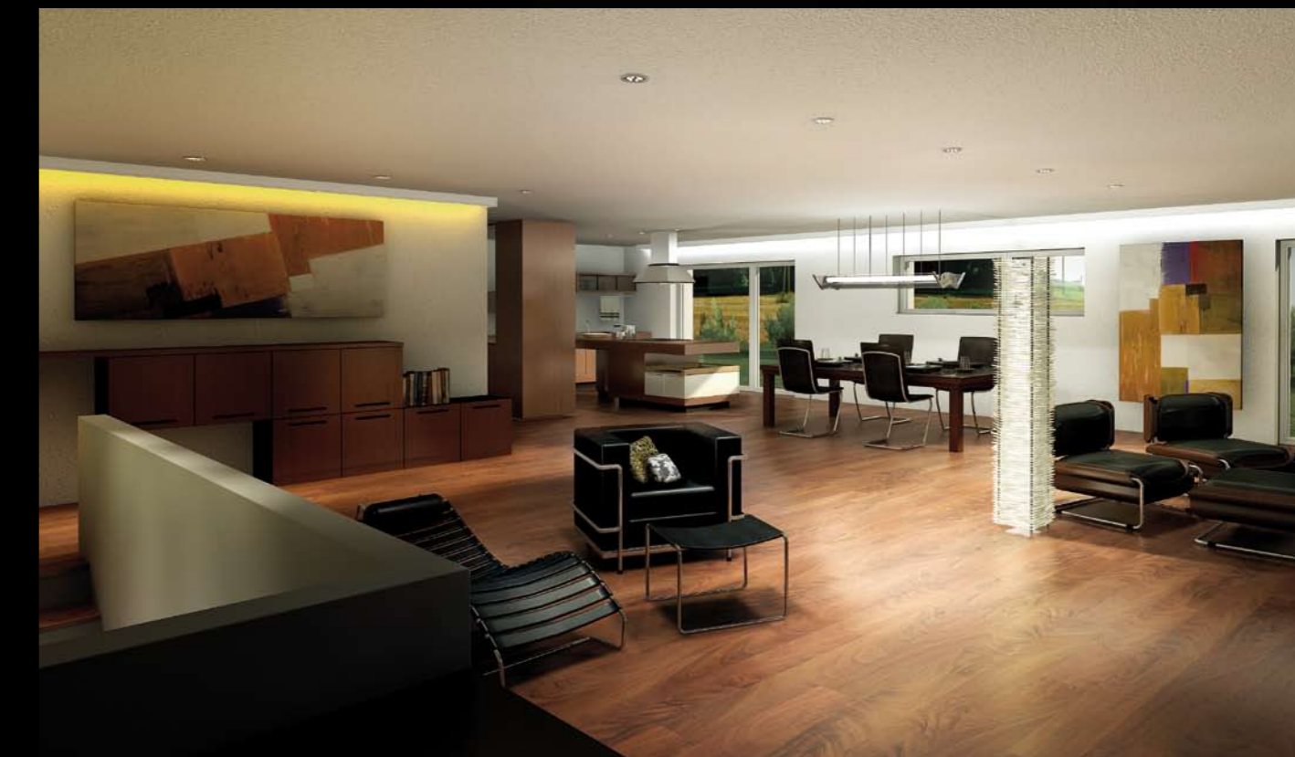
Räume die Sie verzaubern werden