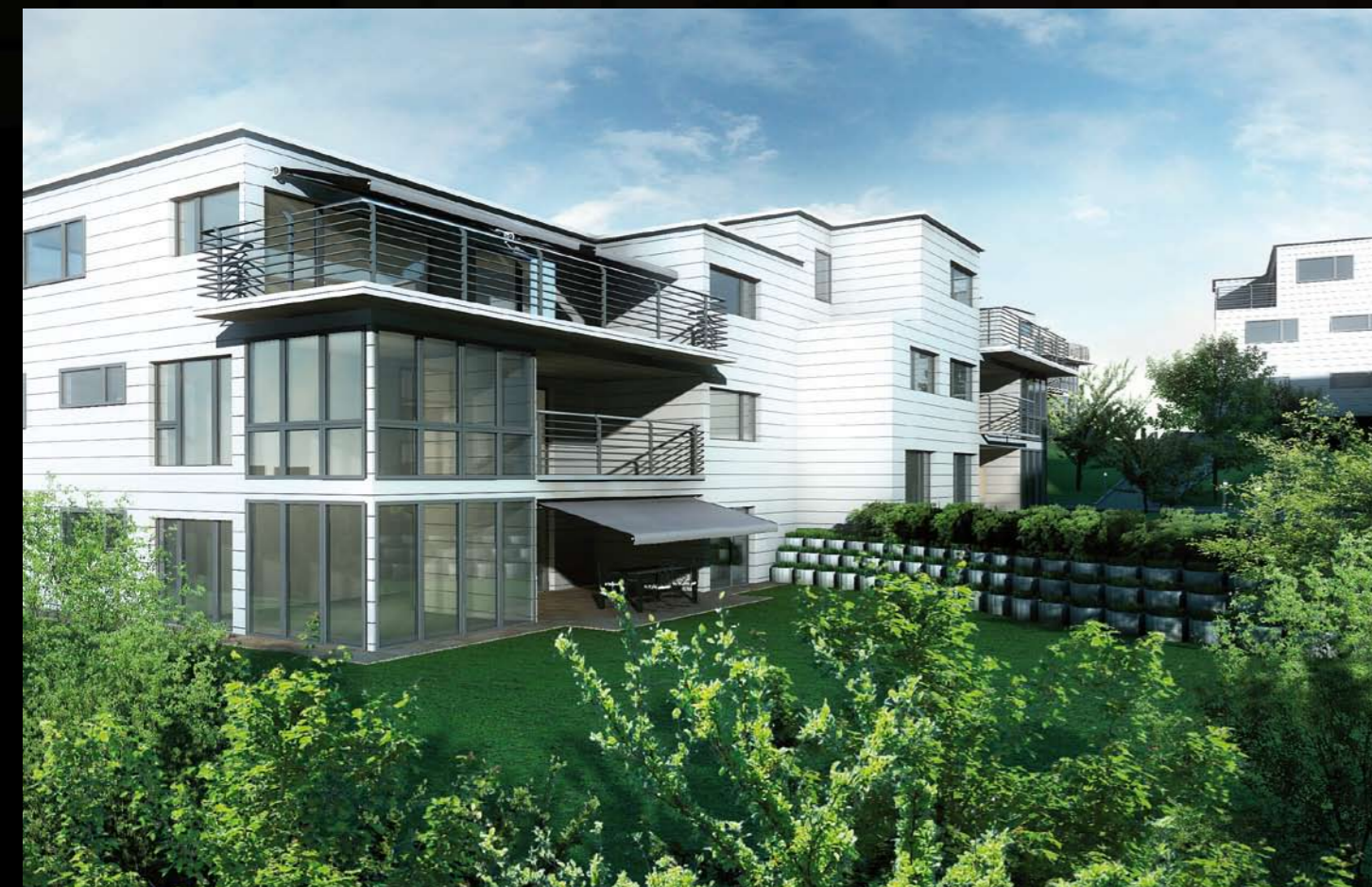
Die grosszügigen Gartenanlagen und Terrassen bieten Ihnen viele Freiheiten