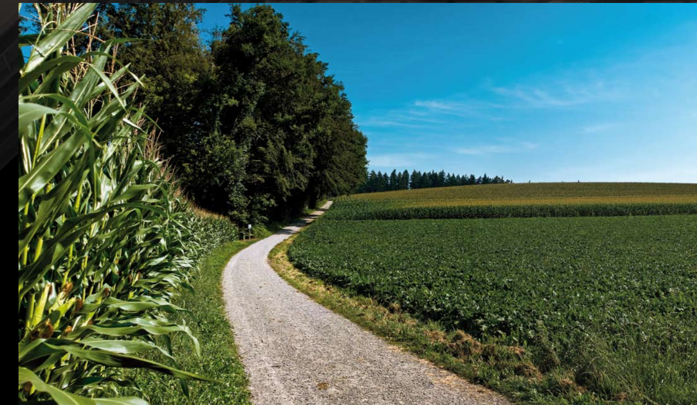
Die wunderschöne Umgebung eignet sich ideal für Spaziergänge und andere Freizeitaktivitäten