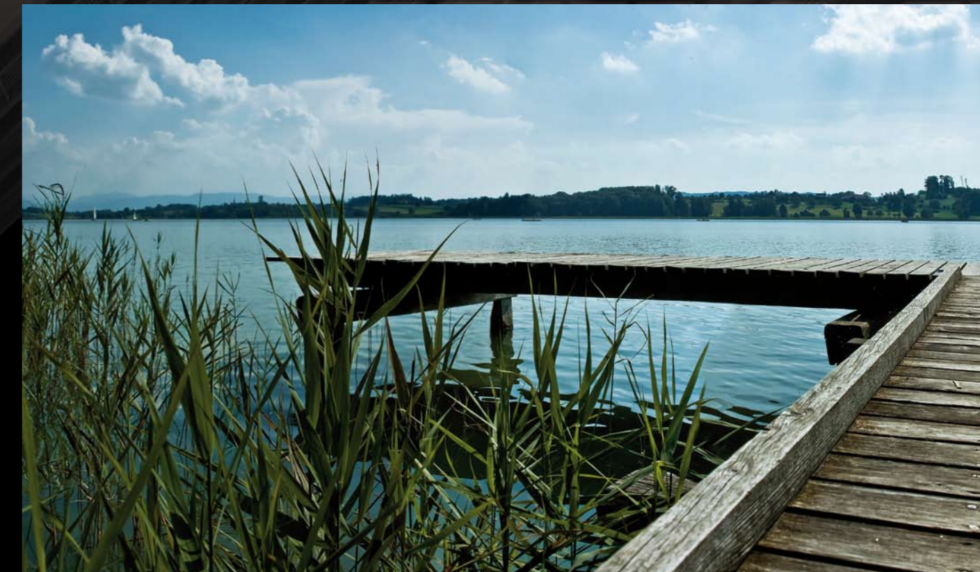
Die nähere Umgebung direkt am See bietet viele Annehmlichkeiten