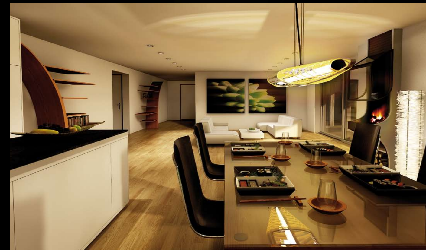
Die grossflächigen Räume gewähren höchsten Komfort