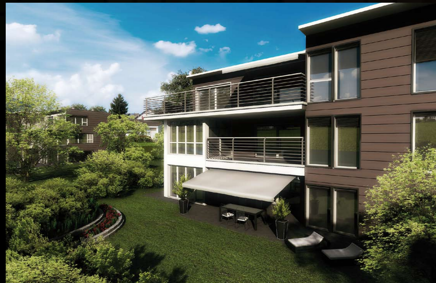
Die Fassade besticht durch exquisite Materialien