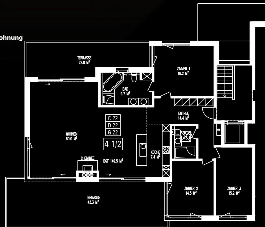
Attika 4 ½ - Zimmer-Wohnung